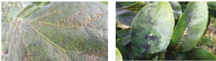
Daño directo e indirecto de pulgones.

BioOrius ( Orius laevigatus ), una chinche pirata depredadora que es omnívoro y se alimenta también de polen como de una gran variedad de insectos presa.